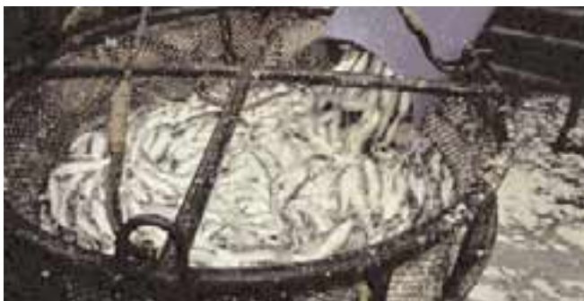
Pompage de harengs sur le bateau

Les harengs sont pêchés dans la Manche sur les côtes françaises, dans la mer du Nord vers les côtes de l'Allemagne et du Danemark, et jusqu'en Suède. C'est le poisson le plus consommé par les Européens. Près de 2 millions de tonnes sont pêchés par an. Le Maatjes est un hareng jeune apprécié aux Pays-Bas.