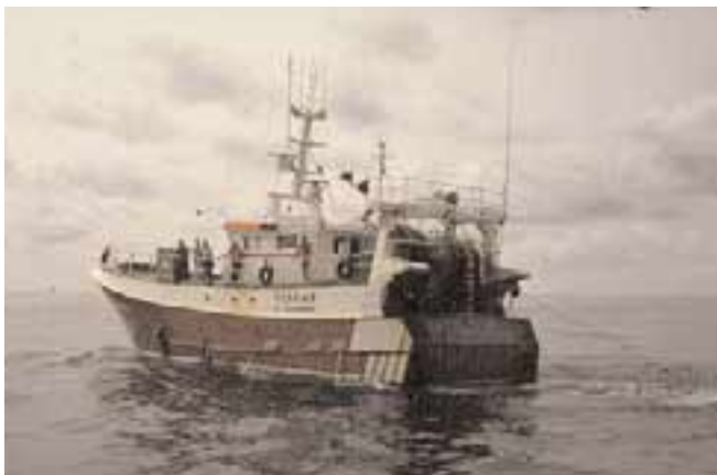
Chalutiers en pêche

On compte 100 000 navires pour l'ensemble des 15 pays de l'Union européenne. La Grèce a le plus grand nombre de navires, plus de 20 000. Mais les 18 000 bateaux espagnols sont plus grands et plus puissants que le reste de la flotte européenne. L'Italie est le troisième pays avec 16 500 bateaux suivie par le Portugal avec 12 000. Il y a deux absents parmi les pêcheurs, ceux qui n'ont pas de littoral marin : le Luxembourg et l'Autriche.