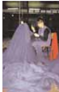
Fabrication de filets de pêche