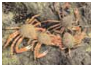
Araignées de mer

■ Les pouces-pieds sont les rares crustacés à vivre fixés sur les rochers. Les espagnols les mangent tièdes en apéritif (dans les tapas). Le principal gisement de pouces-pieds se situe actuellement au sud de la Bretagne. Ce gisement a beaucoup souffert de la marée noire de l'Erika, en 1999. Les pouces-pieds sont également présents sur la côte Nord de l'Espagne (Galice).