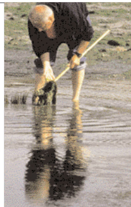
Pêche à pied.

Les grandes marées sont plus intéressantes car la mer se retire plus loin. Elles découvrent de nouveaux terrains de pêche plusieurs fois par an. Ce phénomène de marée est de très faible amplitude en Méditerranée, car c'est une mer fermée.