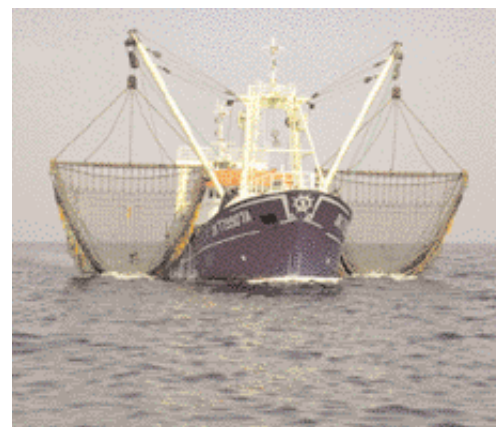
Chalutier à perches

L'équipage est plus nombreux car la pêche est pratiquée 24 heures sur 24.