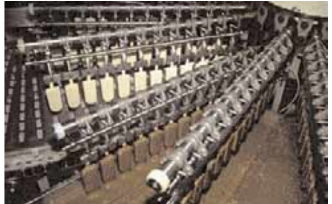
Fabrication de glaces

Les additifs alimentaires : si nous consommons peu d'algues sous forme de condiments en Europe, nous en consommons en revanche beaucoup sous forme d'additifs alimentaires. Les extraits* d'algues rentrent dans la composition de nombreux produits car ils servent à gélifier, épaissir, émulsionner... Ils sont présents dans les produits laitiers, les crèmes glacées, la mayonnaise, le ketchup, les jus de fruits, les pâtisseries... Les additifs alimentaires qui vont de E400 à E407 sont en fait des additifs extraits d'algues. Aux Etats-Unis, des emballages de volailles fabriqués à base d'algue (E407) servent aussi à attendrir la viande pendant la cuisson !