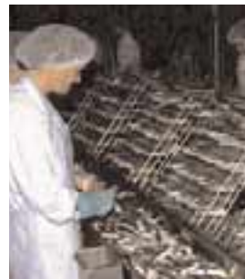
Conserverie de sardines