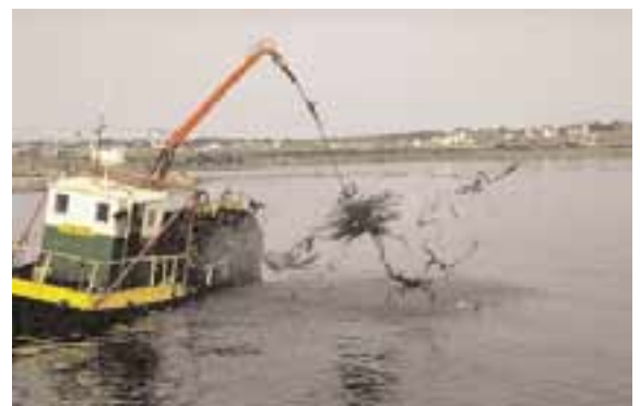
Récolte d'algues sur gisement naturel

Certaines microalgues sont toxiques pour l'homme. Lorsqu'elles sont présentes dans les produits de la mer que nous consommons, elles peuvent être alors très dangereuses.