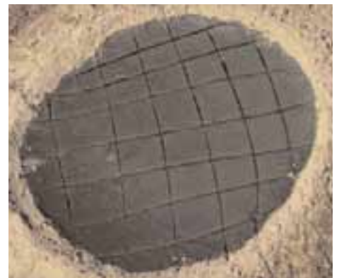
Séchage de la spiruline au Tchad

Les aztèques, au Mexique, mangeaient une microalgue bleue, la spiruline. Aujourd'hui encore, les habitants du Kanem, dans les déserts du Tchad, consomment cette algue. Manger 10 g de spiruline séchée apporte autant de protéines que 80 g de steak.