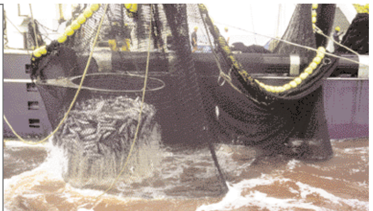
Thonier sennear tropical

La pêche est réglementée au niveau de l'Union européenne. Il y a des règles communes pour les différents pays membres. Ces règles indiquent, par exemple, les lieux où l'on peut pêcher et les quantités de poissons que l'on peut pêcher. Pour les crustacés, les coquillages et les céphalopodes, la pêche à pied et surtout les braconniers faussent les statistiques : cela devient alors difficile de connaître précisément les quantités et les espèces présentes dans les mers pour pouvoir les préserver. Cette réglementation a pour objectif de conserver les diverses espèces de poissons tout en répondant à la demande des pêcheurs et des consommateurs.