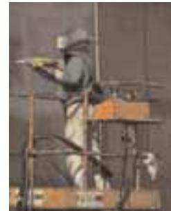
Entretien des bateaux