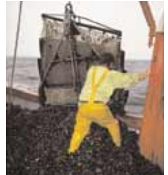
Drague à moules

■ Il existe aussi quelques gisements naturels. Les moules sont alors ramassées par un bateau équipé d'une drague*. Beaucoup de pêcheurs amateurs profitent des grandes marées pour aller cueillir les moules fixées sur les rochers.