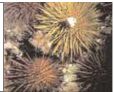
Oursins recherchés pour la consommation

L'étoile de mer et l'oursin font partie de la même famille : les échinodermes. Mais en Europe, seuls les oursins sont consommés. Ils sont particulièrement appréciés dans les pays du pourtour méditerranéen. On les pêche en plongée en Méditerranée, et à marée basse dans l'Atlantique.