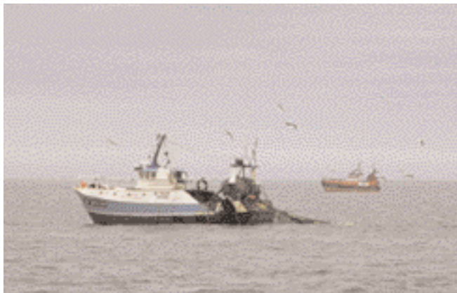
Chalutiers en pêche