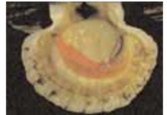
Coquille Saint Jacques

■ En Europe, les coquilles Saint Jacques et les pétoncles sont des coquillages sauvages, pêchés à l'aide de drague*. En Asie, ils sont de plus en plus cultivés. Ils sont souvent vendus déjà décortiqués sur les marchés.