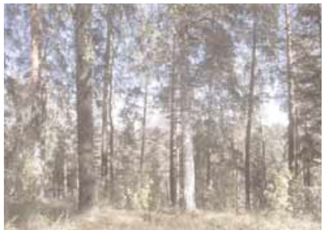
Bouleaux et résineux sont les arbres de la forêt boréale.