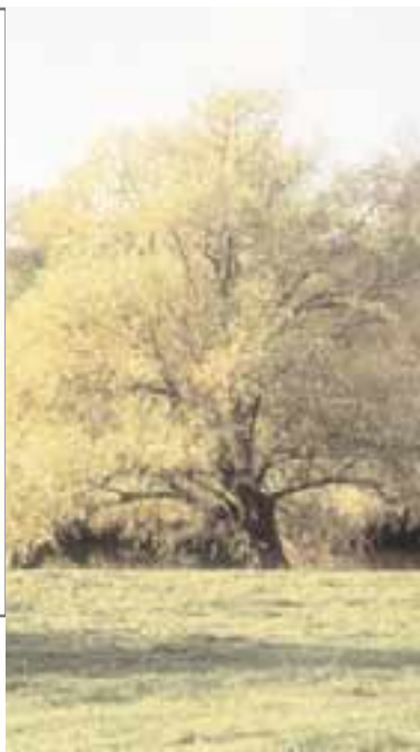
L'aspirine est extraite de l'écorce de saule.

Mais d'autres arbres peuvent être dangereux: l'acacia par exemple, a une fleur qui se consomme en beignet mais ses graines sont toxiques !