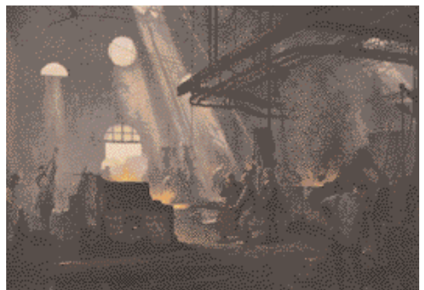
Les forges utilisaient beaucoup de bois.

Cependant, l'industrialisation a permis d'améliorer les connaissances sur le bois : l'industrie des voitures et des avions, par exemple, est à l'origine de la fabrication du bois contreplaqué.