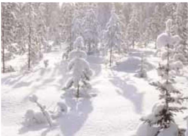
L'hiver dure de longs mois.

L'eau est abondante. Il y a beaucoup de marécages. Les graines ont des difficultés à germer dans ces conditions. Il faut souvent assécher le sol, en creusant des fossés, afin de permettre à la forêt de se régénérer.